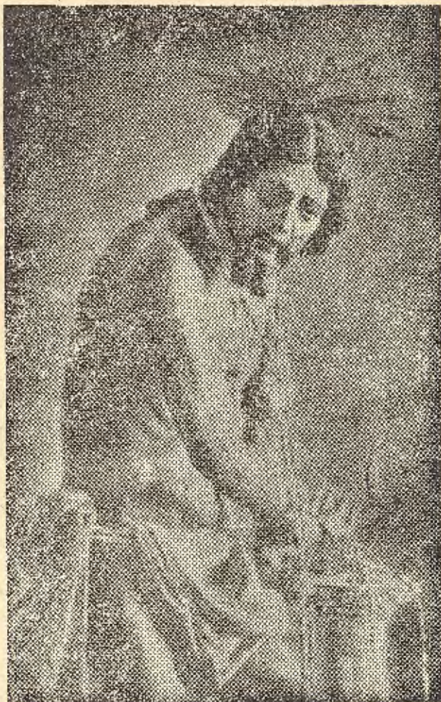
Ntro. Padre Jesús en la Columna cuyas fiestas terminan hoy con la mayor solemnidad

certe adiós, tomándolas prestadas con, aquellas de Amado Nervo: quien te vió no te pudo—ya jamás olvidar!