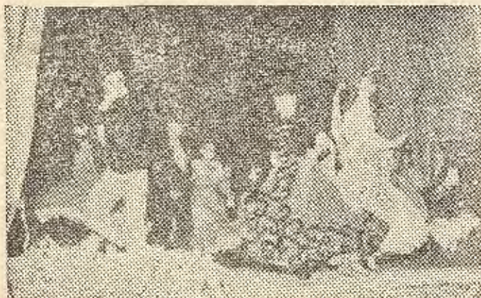
El ballet en «La Verbena de la Paloma»