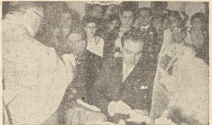
El virtuoso y querido Prelado de Jaén en un momento de la ceremonia