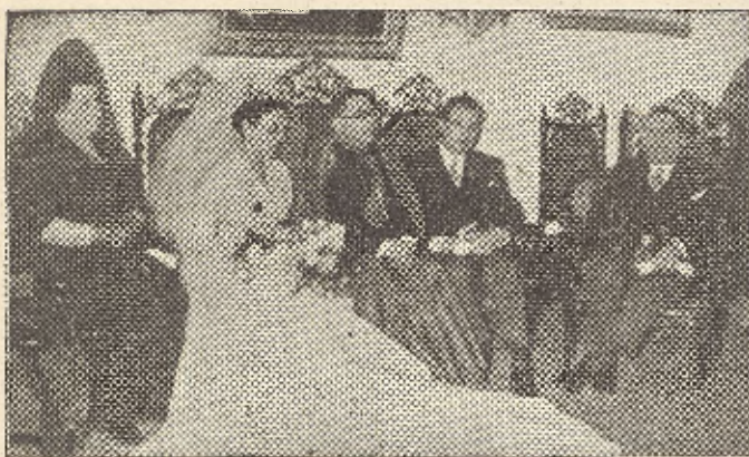
El Prelado de Jaén acompañado de los nuevos esposos y padrinos

Las dos partes restantes (2ª y 4ª) se destinaron al canto, consiguiendo un