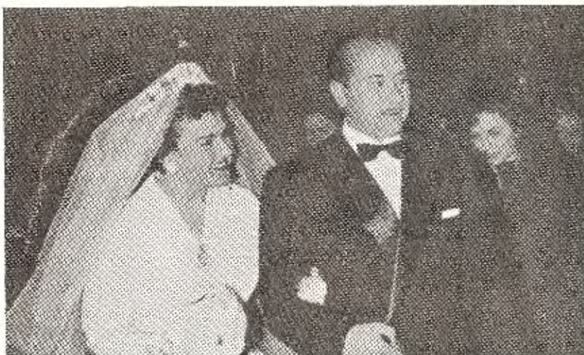
El nuevo matrimonio al salir del templo