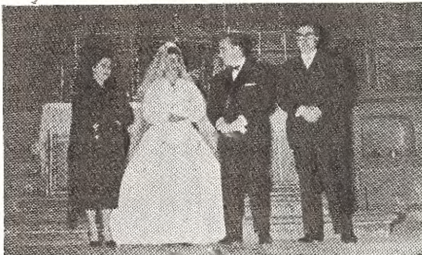
Los novios, con sus padrinos, al pie del altar parroquial