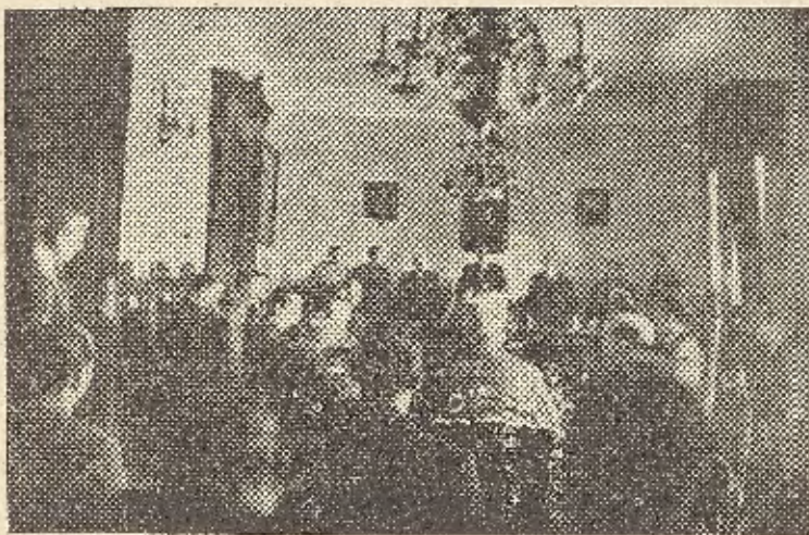
JURA DE LOS CONCEJALES

Seguidamente se procedió a la Jura de los nuevos concejales que lo hicieron en orden de los tres grupos representativos, sobre rico libro de Evangelios con filos de plata, del Siglo XVIII, propiedad de nuestra Parroquia de la Asunción.