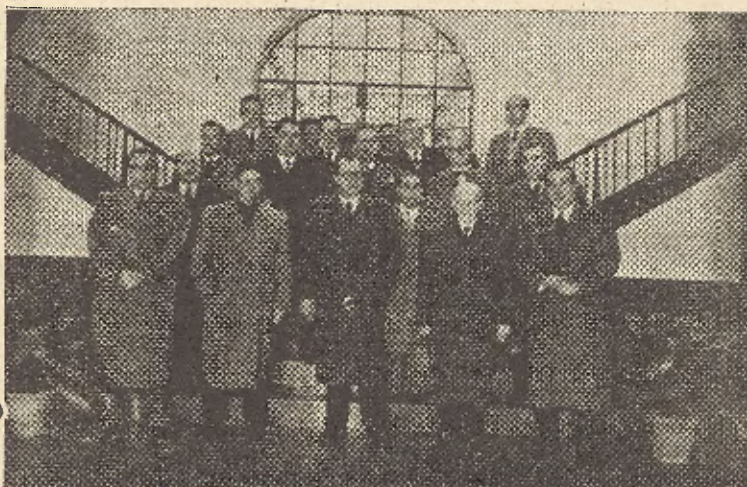
LA NUEVA CORPORACION MUNICIPAL

Los restantes funcionarios, es decir, los de oficinas centrales, técnicos de obras y subalternos disfrutan de las remuneraciones mínimas que la Ley les concede, pero, teniendo en cuenta el Ayuntamiento que para cumplir debidamente con una función ha de atenderse como tarea primordial a cubrir las necesidades que como seres humanos y padres de familia tienen, estos funcionarios, siguiendo en ello el espíritu de la propia Ley, las normas de nuestro Estado y las exigencias de la Doctrina Social de Nuestra Santa Madre Iglesia Católica, se les han concedido los Pluses de Cargas Familiares y de Carestía de Vida que ya, ha mucho tiempo, tienen establecidos muchísimos Ayuntamientos y que el propio Estado les hace llegar a sus servidores por la nunca bien elogiada Ayuda Familiar; porque, señores Concejales, no podemos cerrar los ojos a la cruda realidad que nos revela la dificultad extraordinaria con que los funcionarios pueden atender a sus necesidades con los exigüos medios de sus cortos