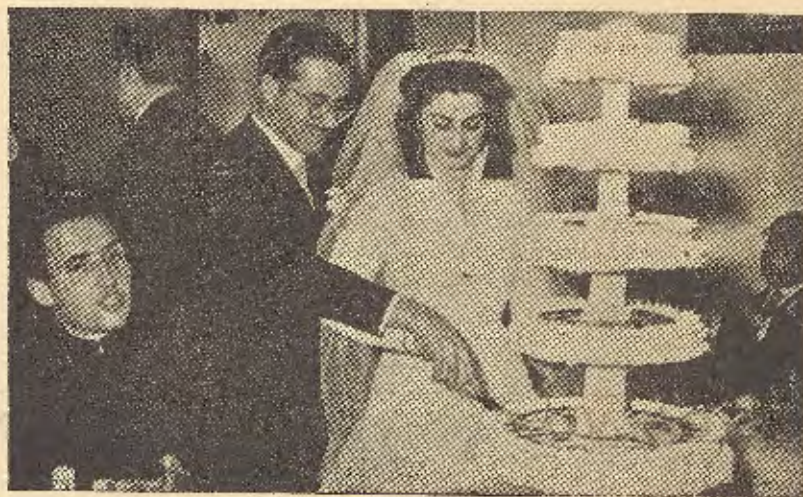
Momento en que los novios parten la tarta nupcial