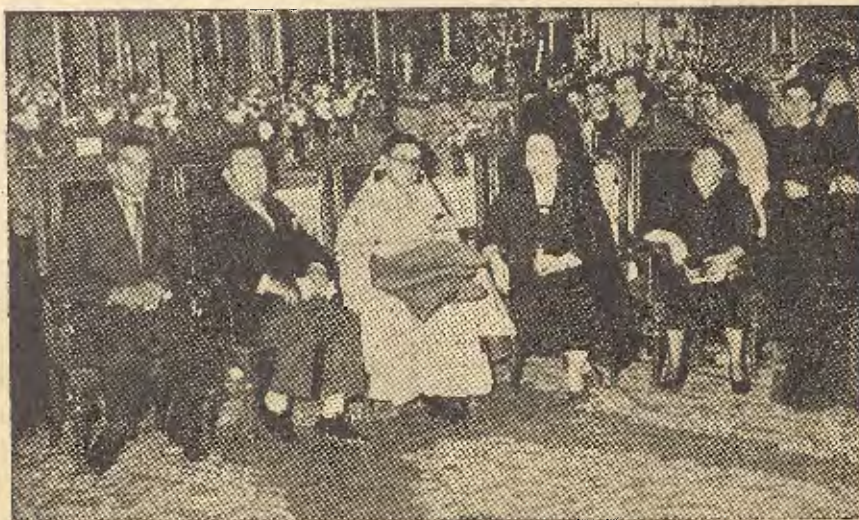
El nuevo Ministro del Señor, con sus padrinos y padres, al iniciarse el besamanos