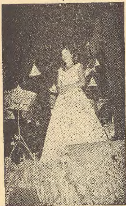
La bellísima y eminente soprano Pilar Lorengar en una de sus ex- quisitas interpretaciones