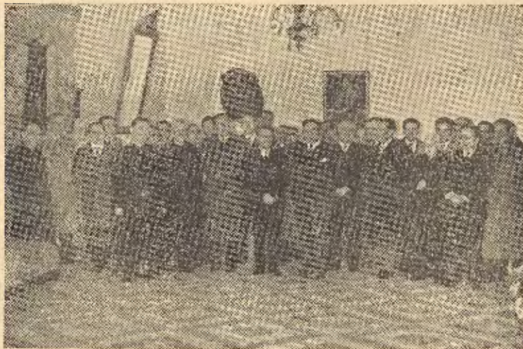
El ilustre filósofo, con los Directivos de la Sección e invitados, posan para el objetivo de Calvo en el Salón de Actos del Casino