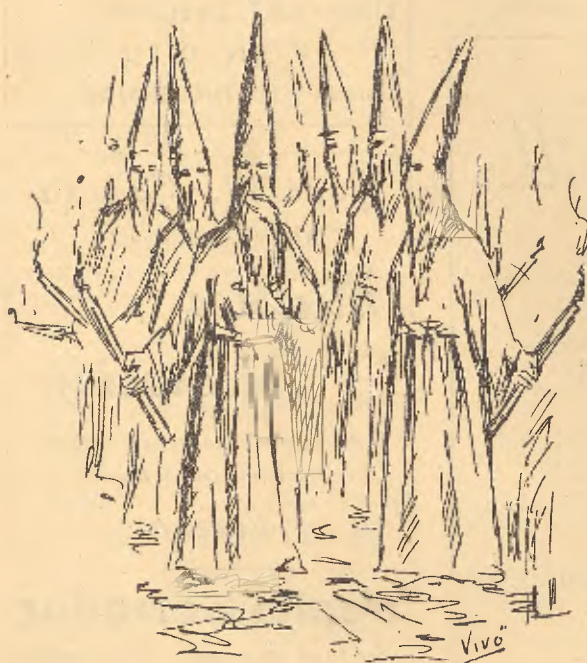
Grupo de penitentes columnarios en la tarde del Jueves Santo