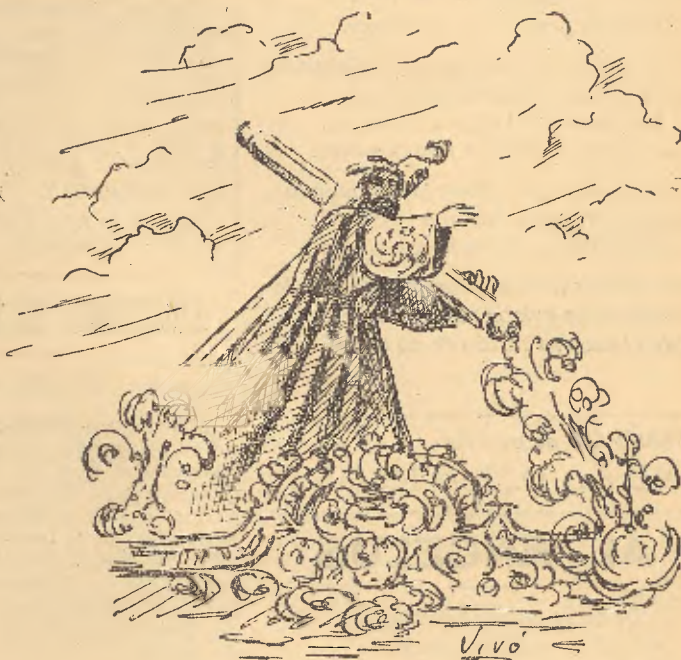
Ntro. Padre Jesús Nazareno bendice al pueblo, desde el Calvario, en la mañana del Viernes Santo