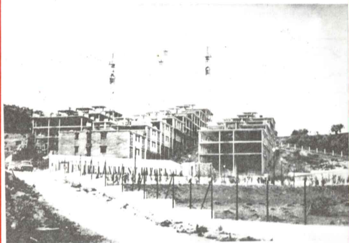
Dos instant6neas de las obras que se llevan a cabo para sesenta viviendas sociales.