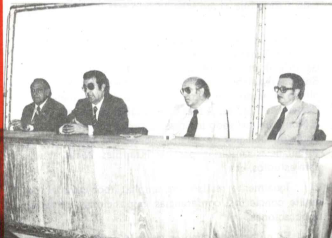
Un momento de la reuni6n celebrada por la Agrupaci6n Provincial de Empresarios de Peque6a y Mediana Empresa del Comercio de C6rdoba, el pasado 13 de Octubre en nuestra Ciudad. Inf. p6g. 10..