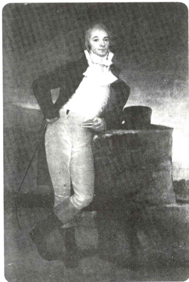
El marqués de San Adrián. Goya. Museo de Navarra.