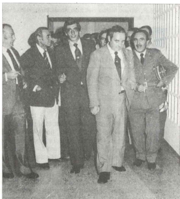
El Gobernador Civil, en compañía del Comisario Jefe Provincial y el Comandante de la Policía Armada de Córdoba visitaron el día 10 las dependencias (locales de la A.I.S.S.) donde quedaron ubicadas la Comisaría de Policía y Cuartel de la Policía Armada. (pág. 7)