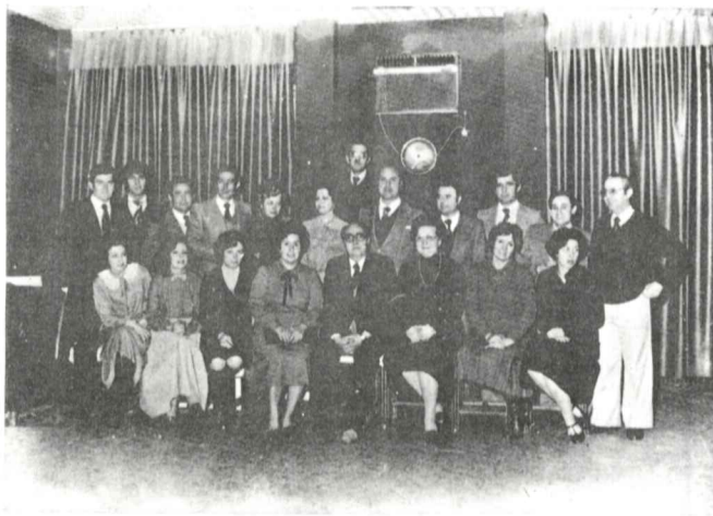
El equipo de Adarve, posó para el objetivo de Serrano Baena.

Como en años anteriores, se reunieron el pasado 28 de enero en el Hostal Rafi, el personal de Redacción y Talleres de Adarve, celebrando en comida de Hermandad la festividad del Santo Patrono del Periodismo, San Francisco de Sales. Al acto se sumaron también algunos colaboradores invitados, transcurriendo todo él, en un ambiente de cordialidad y compañerismo.