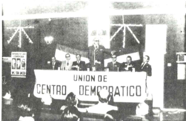
Un momento del mitin celebrado en Priego

Los candidatos por la lista de U. C. D. no queremos hacerte ninguna interesante y halagüena promesa por si no podemos cumplirla después.