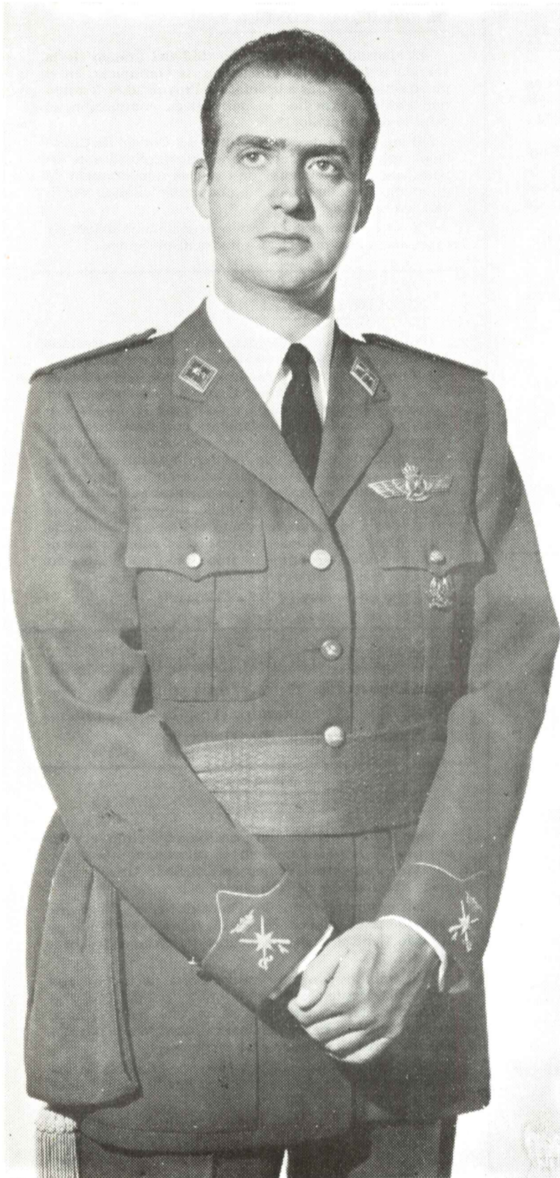
S. M. JUAN CARLOS I REY DE ESPAÑA JEFE SUPREMO DE LAS FUERZAS ARMADAS

CON MOTIVO DE LA CELEBRACION DEL "DIA DE LAS FUERZAS ARMADAS" Y SOLIDARIZANDONOS CON EL DOLOR DE TODO EL PAIS ANTE LOS ATENTADOS Y MUERTES DE MILITARES Y CIVILES.