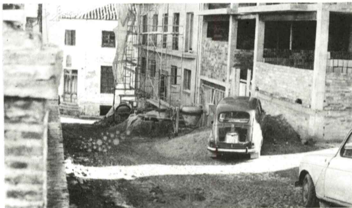
¿Habrà que esperar a que se termine esta obra para poder circular por esta calle?