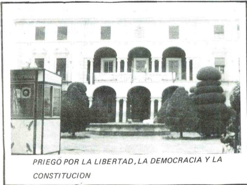
PRIEGO POR LA LIBERTAD, LA DEMOCRACIA Y LA CONSTITUCION

II EPOCA - AÑO VI - NUM. 117 - DOMINGO 15 DE MARZO DE 1.981