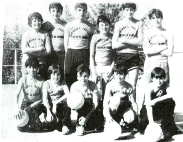
.- Voleibol Infantil (C.N. Cristóbal Luque Onieva).

Deseamos los mejores éxitos para nuestros escolares que tan bien dejan el nombre de nuestro pueblo en dichas competiciones. Seguiremos informando.