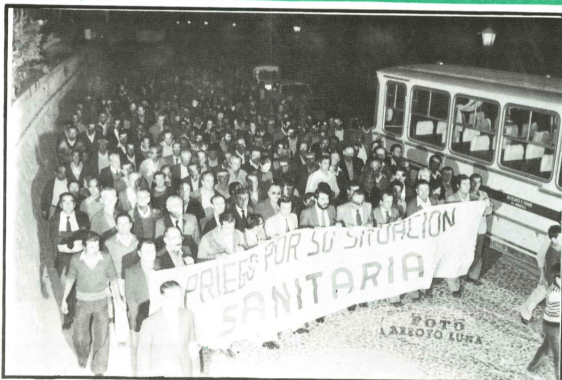
Uno de los instantes en que la manifestación pasa por nuestras calles de Priego.

II EPOCA — AÑO VI - NUM. 134 MARTES 1 DICIEMBRE 1.981