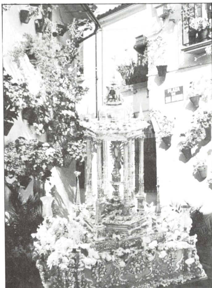
CORPUS CHRISTI 1984 PRIEGO DE CORDOBA

* CURSO DE PERFECCIONA- MIENTO PARA POLICIAS MUNICIPALES