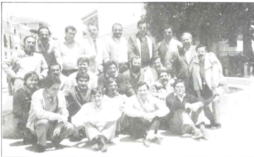
Un grupo de profesores y antiguos alumnos en la Fuente del Rey