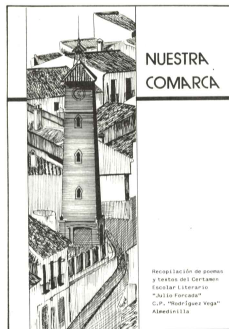
Portada del libro "Nuestra Comarca"