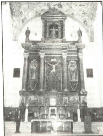
Retablo del altar mayor de la iglesia de Fernán-Núñez, provincia de Córdoba.