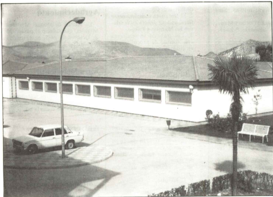
Vista panorámica del Centro de Salud, un gran edificio para pequeños logros