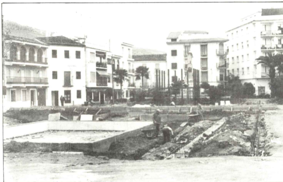
Priego tendrá un gran parque en la Plaza del Llano