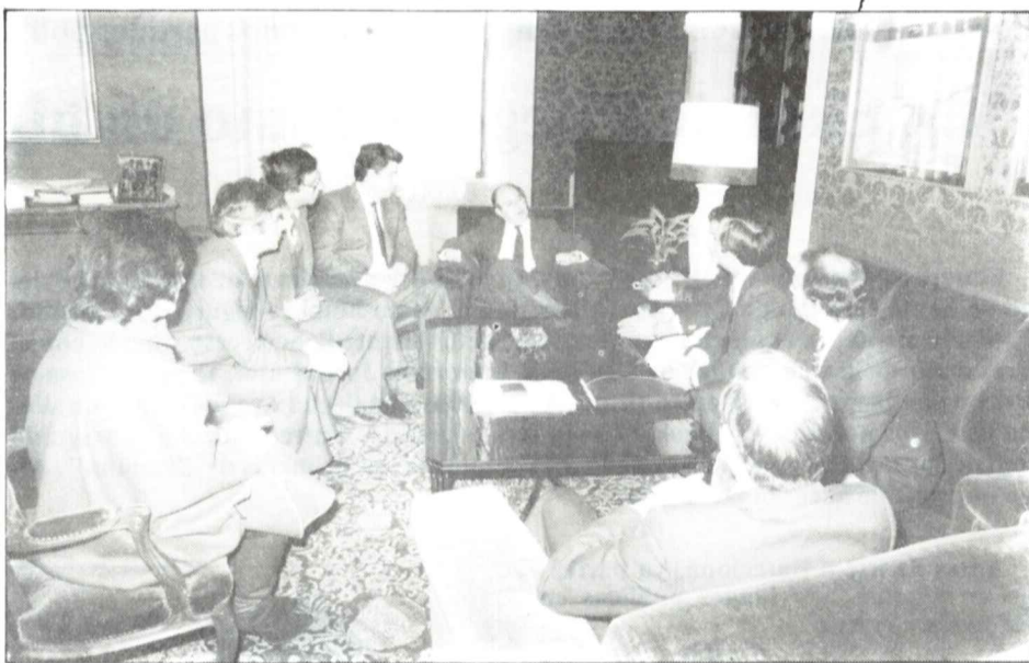
Directivos de la Casa de Priego con Jordi Pujol

No tengo fecha, pero puede que la deje, porque estoy recibiendo muchas ingratitudes por parte de algunas personas. Nadie me ha dicho que me vaya, pero yo estoy un poco dolorido. Yo he cumplido mi meta, conseguir que la Casa de Priego sea una de las primeras de