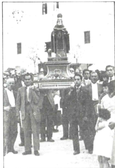
La procesión de San Antón hace unos 30 años

Este año, tras la solemne función religiosa, el Sr. Párroco dijo que, por diversas causas, no saldría la procesión. Hombres y mujeres pensaron que las razones no eran válidas y, contra la voluntad del párroco, abrieron las puertas de la Iglesia y sacaron al Santo paseándolo entre vivas y cohetes por las calles de la Aldea. Por la noche, como siempre, hubo rifa, amenizada con música. Y no faltaron los típicos 'testuzos' de cerdo, que alcanzaron buenos precios en la subasta. Así Castil de Campos, una vez más, celebró la fiesta de su patrón.