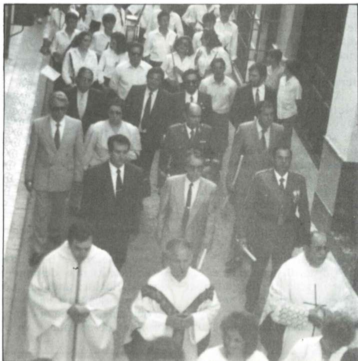
Autoridades y Banda de Música en el Corpus 88

clo de Mayo se celebró el 2 de Junio la fiesta del Corpus con un desfile procesional en el que participaron representaciones de todas las Cofradías y Asociaciones religiosas así como las niñas y niños que han realizado este año la 1.ª comunión.