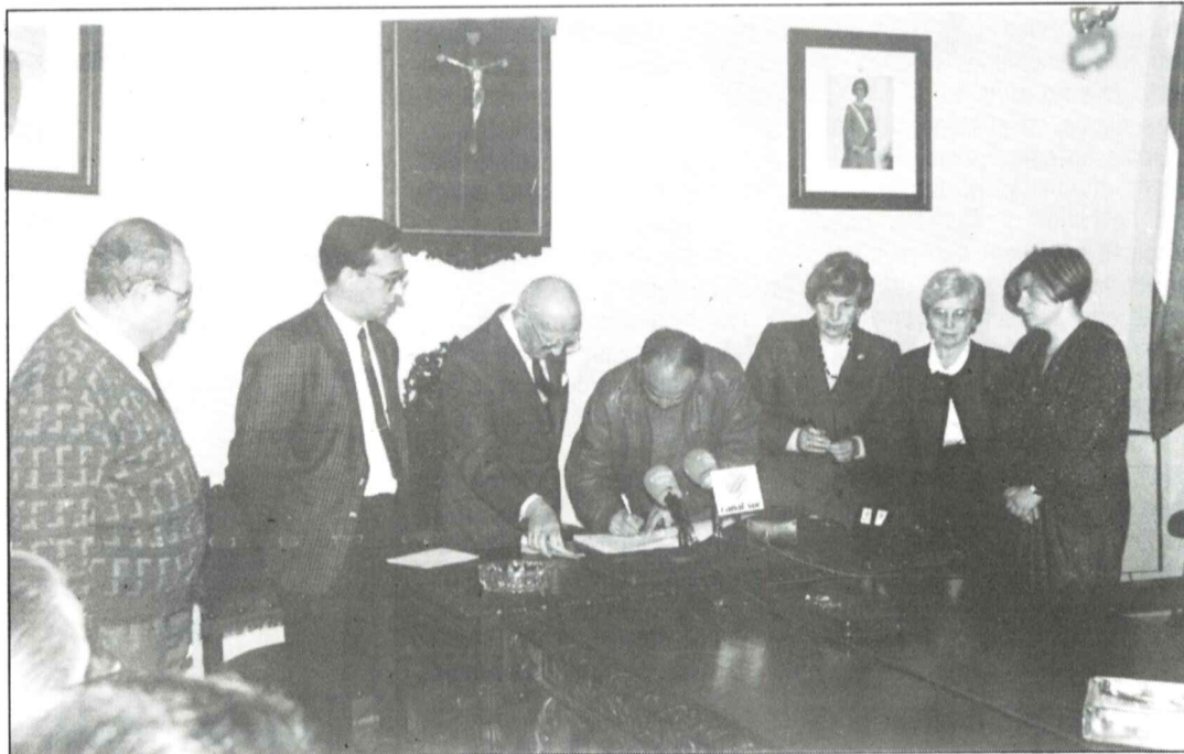
Entrega de cheques, la Cruz Roja gestionó la donación.