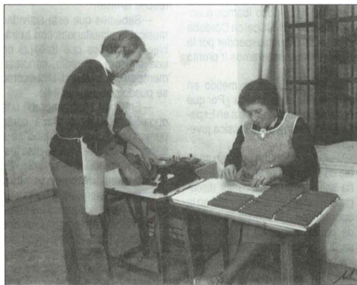
Los hermanos Merino en su trabajo