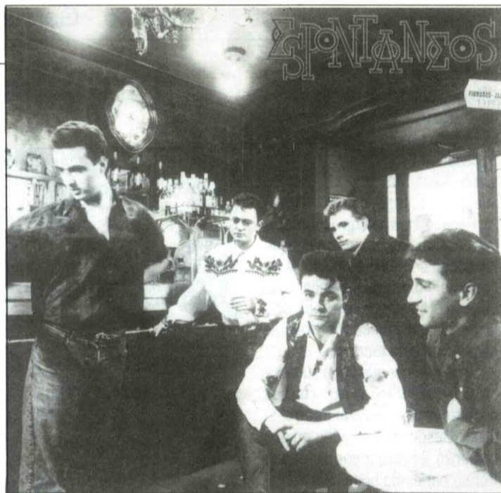
Portada del disco que lleva por título el nombre del grupo

—Nunca nos ha gustado encasillar nuestra música en ningún tipo, forma ni influencia, sino que nuestra música ha sido simplemente fruto de cinco personas de diferentes edades, diferentes gustos que solemos hacer lo que nos gusta. En nuestro LP se notan muchas influencias; lo que más nos gusta es hacer canciones que suenen a la vida cotidiana: a la tasquita, a tomarse un aperitivo, a tomarse una ración de jamón y un vino fino,