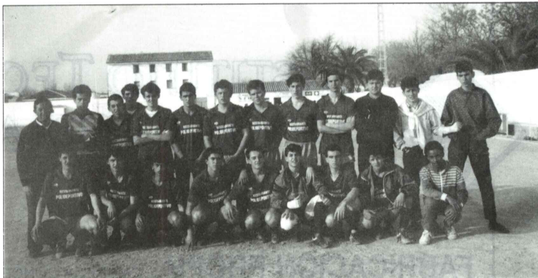
Atlético Prieguense Juvenil

Los resultados que obtuvieron, en sus diferentes confrontaciones fueron las siguientes, al Lucena se les ganó por 0-2 en Lucena en un gran partido y en casa por 4-2; al Rute se les ganó por 1-3 y en casa por 1-0. En Aguilar se les ganó por 0-8 en el mejor de todos los partidos, y en casa se les ganaba también por 5-1. Contra los de Cabra no se pudo ni en casa ni fuera, y no es que se jugará mal sino que la suerte estuvo aliada con los de Cabra; se perdía en casa por un 2-4 y fuera por 3-2. Con Baena se hizo el peor partido de todos y se perdía por 3-2, en casa se jugó mejor y se le ganaba por un rotundo 4-0, que en definitiva ha servido para proclamarse campeones. Contra Nueva Carteya se le ganaba en casa por 3-2 y fuera por 4-2. Con Montilla se perdía por 4-2 y se le ganaba en casa por 2-1. Al Benamejé se le ganaba por 3-1 y 2-1. En definitiva se ganaron doce partidos y se perdían cuatro; lástima que la afición no apoye a estos juveniles ya que la asistencia a los partidos es escasísima. Desde aquí animamos a los juveniles para esa liguita de ascenso y ojalá Serafín lo consiga, porque te lo mereces, ánimo y a por el triunfo. Los partidos que tendrán que enfrentarse a partir del 25 de febrero son Fuente Palmera, Villa del Río y Cardeña.