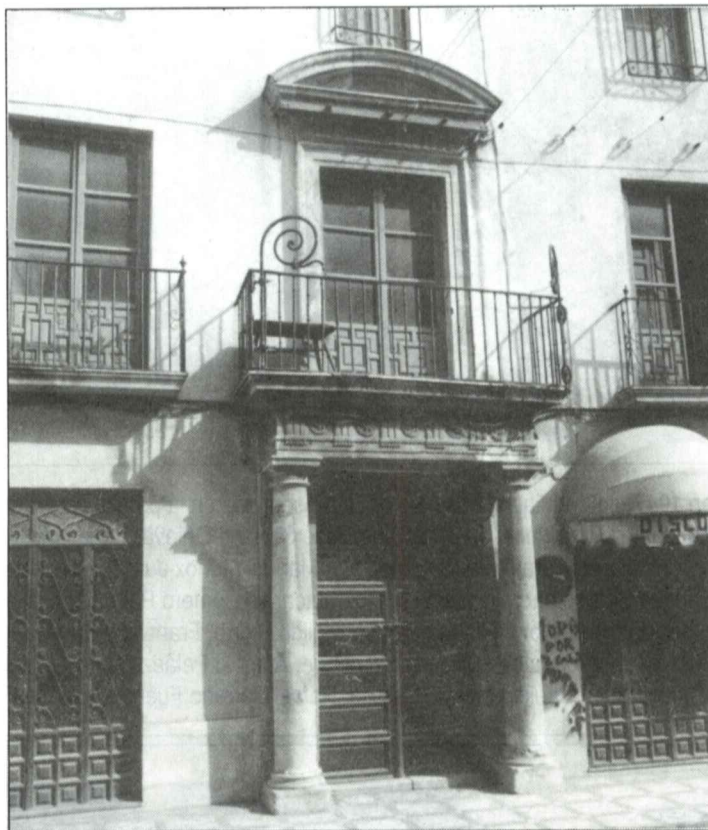
Fachada del Casino de Priego