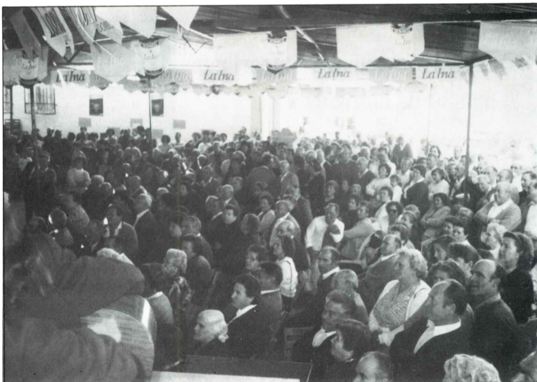
Asistentes al día de convivencia.

La jornada del día 20 se desarrolló desde primeras horas de la mañana con el desplazamiento de los participantes de las distintas aldeas, bien en autobuses o en vehículos propios, contando en todo momento con la presencia de protección civil. A las 12 de la mañana se encontraron en Lagunillas, que se encontraba engalanada con farolillos y guirnaldas, todos los participantes, unas 800 personas, dando lugar a las distintas actividades que amenizaron la jornada, bailes folclóricos, llevado a cabo por el taller de baile de la aldea de