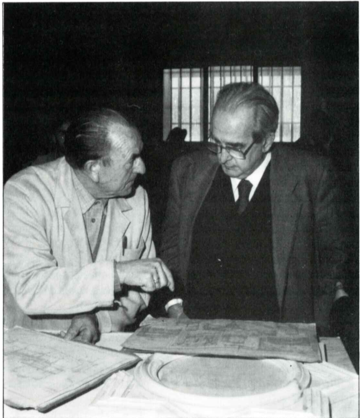
El exministro Fernando Morán atiende las explicaciones de un monitor de la escuela taller.

Terminado el acto el exministro socialista contestó a preguntas de Adarve manifestando que a los distintos organismos de la CEE llegan perfectamente las propuestas de Andalucía de la mano de los parlamentarios andaluces de los distintos partidos y que dichas propuestas son con mucha frecuencia atendidas por lo que Andalucía ha recibido en los últimos años un importante apoyo de la Comunidad. Sobre la falta de protagonismo de la CE en la Conferencia de Madrid, después de afirmar que ha sido maravilloso que esa conferencia