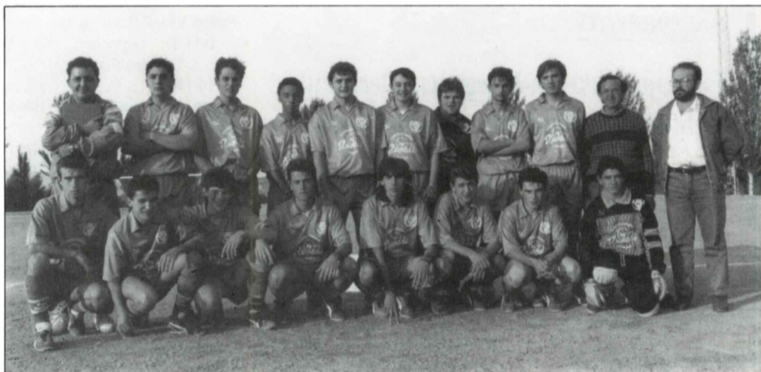
Juveniles. C.F. Confecciones Rumadi.