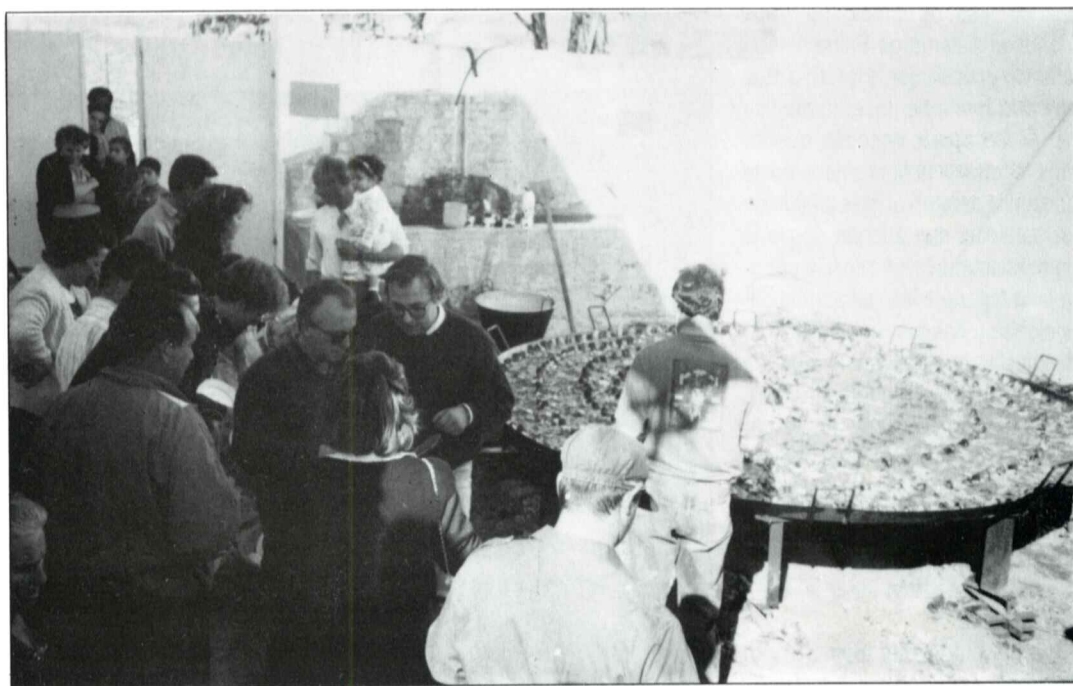
La gran paella.