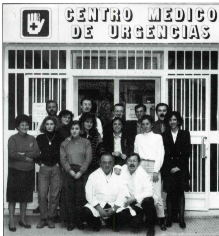
Plantilla del Centro Médico de Urgencias.

Aparte, están algunos los afiliados a Compañías, que no se llevan los taloncillos a la consulta, los dejan a deber y luego se olvidan de traerlos.