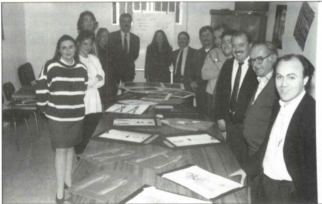
Miembros del jurado ante los modelos seleccionados.