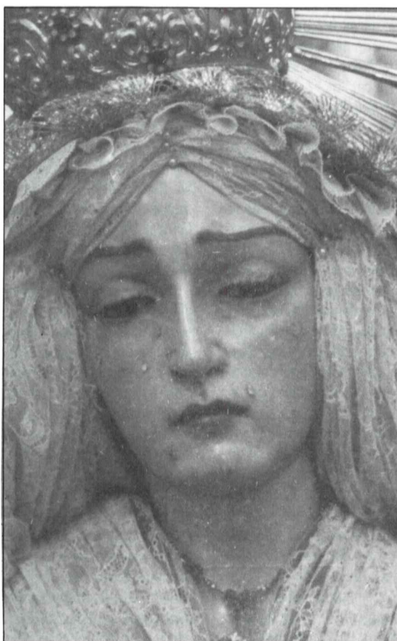
Virgen de la Soledad.

llenarla de contenido cristiano que sirva para nuestra época y para el futuro. Vuestra Cofradía, hermanos de la Soledad y de las demás cofradías de Priego tiene que crecer y crecer en este sentido. Hemos de transmitir como nos han transmitido.