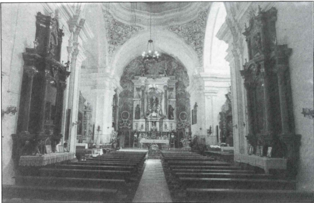
Interior de la Parroquia de la Inmaculada de Benamejí.

Todo este conjunto se encontraba en un avanzado estado de degradación, tanto estructural como estético. Las causas hay que buscarlas en el material base, siendo este exclusivamente madera utilizado en todo el retablo con tablas pequeñas, embutidas en una estructura cuadrículada de listones (muy parecida a las utilizadas en las puertas de cuarterones), siendo el factor causante de la degradación estética ya que las uniones de todos los tableros se han movido aflorando grietas al exterior en toda la superficie, creando un efecto de cuadros que rompen los planos lisos. Dichas grietas surgen en todo el retablo. De la imitación a mármol original sólo quedan las dos columnas grandes en rojo, el resto se encuentra oculto por dos capas de pintura industrial: blanca y marfil aplicadas no hace mucho con la pretensión de ocultar daños.