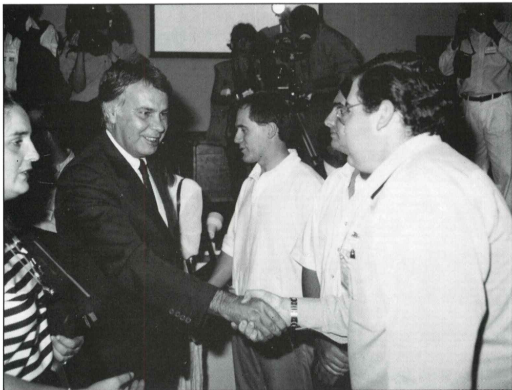
Felipe González estrecha la mano de Fernando Rey tras reunirse con los cooperantes españoles en Nicaragua.

Como Coordinador del Convenio UCA-ESADE-ETEA en Managua, mis principales tareas han