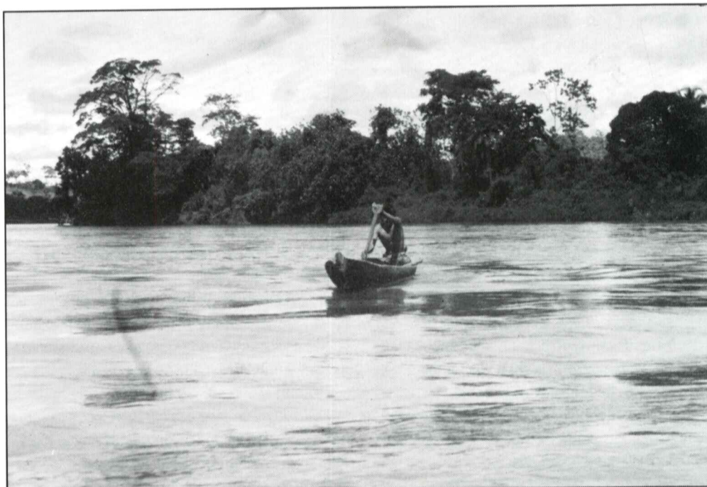
Río San Juan, al sur de Nicaragua, frontera con Costa Rica.

acusado por muchos como somocista convencido, Arnoldo Alemán. El FSLN se ha dividido en varias corrientes, quedando la corriente radical liderada por Daniel Ortega, que después de su problemas de corazón (tuvo un infarto recientemente), ha decidido presentarse nuevamente a las elecciones.