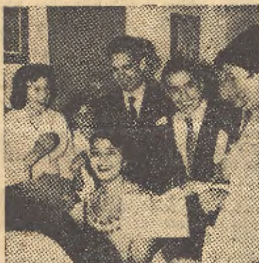
En busca de autógrafos

Priego, una vez más, ha cerrado con unos Festivales de gran altura su anual ciclo artístico.