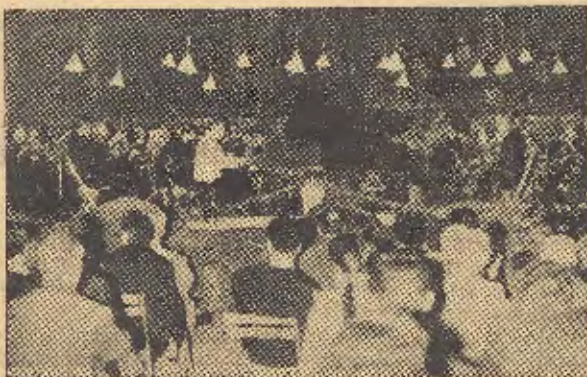
Un momento del concierto en la menor op. 54 de Schumann