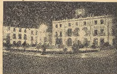
Plaza de Calvo Sotelo