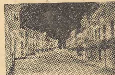
Carrera de Alvarez