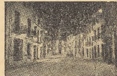
Calle Héroes de Toledo; al fondo fachada y torre de la Parroquia del Carmen