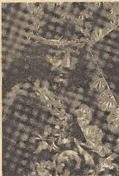
Hoy culminan las fiestas en honor de Nuestro Padre Jesús Nazareno con la presencia del Excmo. y Rvdmo. Sr. Obispo de Jaén

Este el misterio de lo popular en un Cristo tan cercano, tan nuestro que se identifica en cada uno de nosotros al pasar por nuestro lado. Y esta es, en resumen su más alta teología: que no fué Priego quien hizo a Dios tan huma-