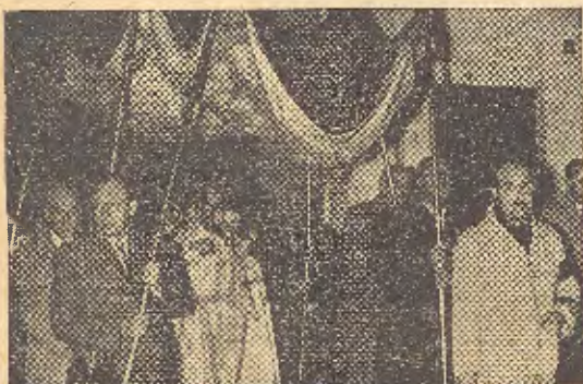
Jesús Sacramentado, bajo palio, es trasladado a la parroquia matriz.