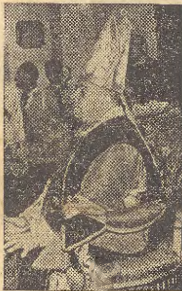
Al terminar el solemne Pontifical Su Excelencia Reverendísima dirige la palabra a los fieles