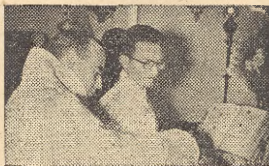
El Misacantano en un momento de la solemne Misa