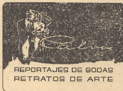
REPORTAJES DE BODAS RETRATOS DE ARTE