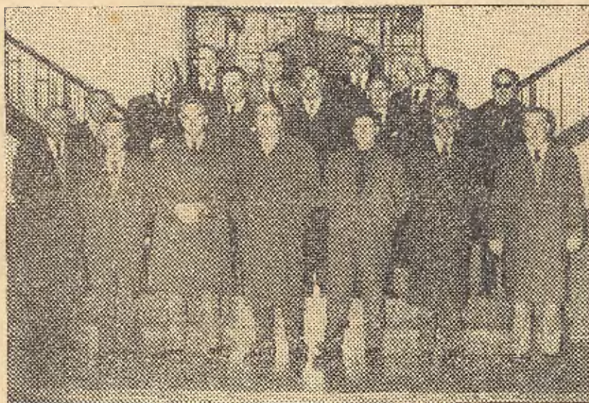
Después de la Sesión pública extraordinaria, los componentes del nuevo Ayuntamiento posan ante el objetivo de Calvo

Terminada esta lectura el presidente llamó a los elegidos, que juraron su cargo de rodillas y sobre los Evangelios del Tesoro de la Parroquia de la Asunción, abiertos por la Dominica de Pentecostés. La fórmula fué: «Juro servir fielmente a España, tener lealtad al Jefe del Estado, respetar y hacer que