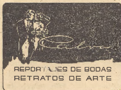
REPORTAJES DE BODAS RETRATOS DE ARTE