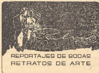
REPORTAJES DE BODAS RETRATOS DE ARTE

El Ilmo. Sr. Delegado Provincial del Trabajo, ha publicado una disposición aprobando el nuevo calendario laboral para 1958, cuyo texto integro daremos en nuestro próximo número.