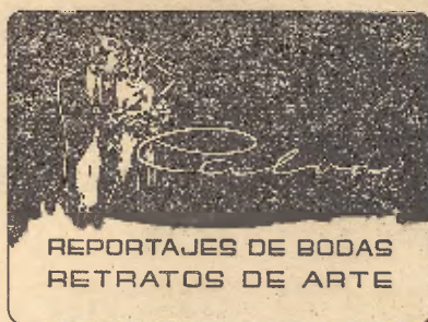
REPORTAJES DE BODAS RETRATOS DE ARTE