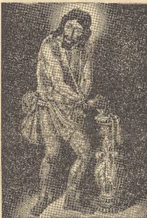
Ntro. P. Jesús en la Columna, original de M. Vivó

En estos cuadros y dibujos que componen la actual exposición, podrán observar los que vieron la primera, que no me conformo en repetir unas formas ya aprendidas y conocidas, sino, que prosigo mi búsqueda por cuantos caminos puedan conducirme a encontrar la expresión plástica que defina la manera de sentir del hombre actual. Quiero decir con esto, que mi pretensión es hacer, no una pintura bonita, sino buena. Un arte sentido y puro, sin concesiones a lo fácil y amanerado. En