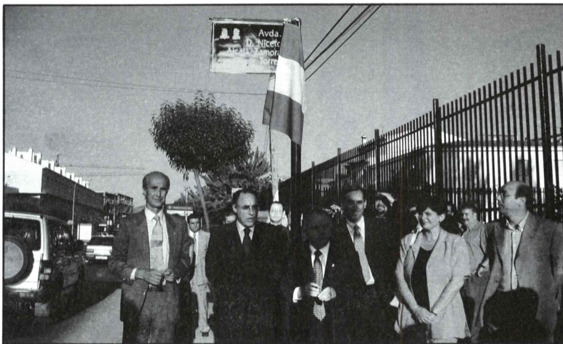
Descubrimiento de la placa que da nombre a la nueva Avenida Alcalá-Zamora.

El pasado 14 de julio tuvo lugar la firma de un convenio de colaboración entre cuatro entidades para la edición de las obras completas de Niceto Alcalá-Zamora y Torres. Tras la firma se sucedieron diversos actos, como la visita a la casa natal del primer presidente de la II República Española; el descubrimiento del rótulo que indica la nueva "Avenida Niceto Alcalá-Zamora y Torres" y por último, la presentación de los dos primeros volúmenes de lo que será la obra completa de Alcalá-Zamora, en un acto que fue presidido por el presidente del Parlamento de Andalucía, Javier Torres Vela.