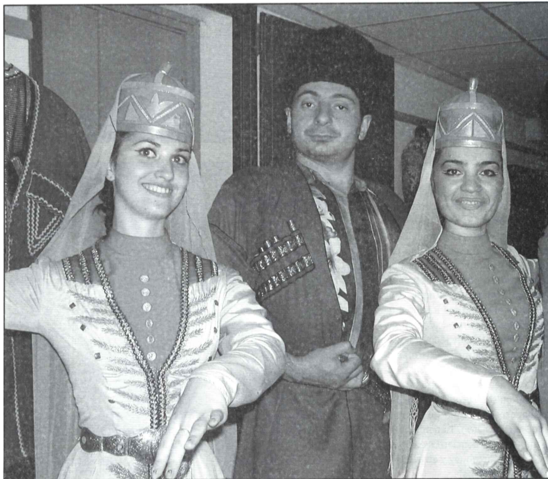
Componentes del Conjunto de Música y Danza "Goretz" de la Federación Rusa.

El pasado 23 de julio tuvo lugar en el teatro Victoria la actuación del Conjunto de Música y "Danza Goretz" de la Federación Rusa. Un espectáculo integrado por 24 bailarines de ambos sexos, que demostraron su destreza en la interpretación de sus bailes, una conjunción perfecta y una coreografía y vestuario realmente sorprendentes. Todo un espectáculo de gran colorido y belleza que caló gratamente entre el escaso público asistente. Una lástima ya que ha sido una de las mejores actividades de este intenso "Julio Cultural"