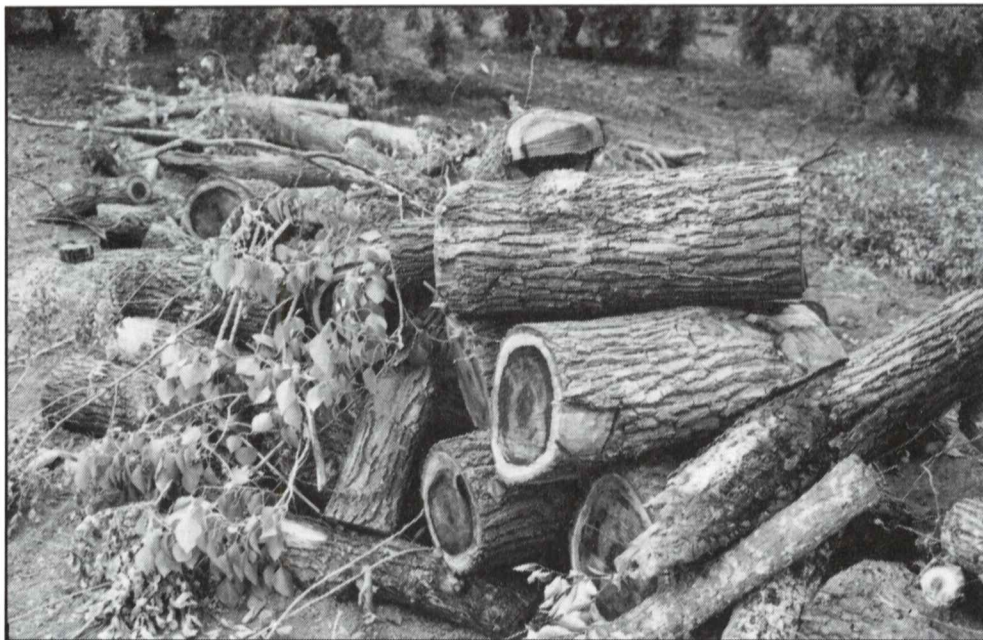
Madera apilada para su posterior combustión con el fin de destruir los insectos transportadores de hongos.

Los trabajos que se están realizando en esta olmeda consisten en la eliminación de los árboles afectados, cortándolos y quemando su madera con el fin de evitar la dispersión del insecto hasta otras zonas no afectadas. El principal problema al realizar esta operación ha sido el importante desnivel a salvar en el momento de