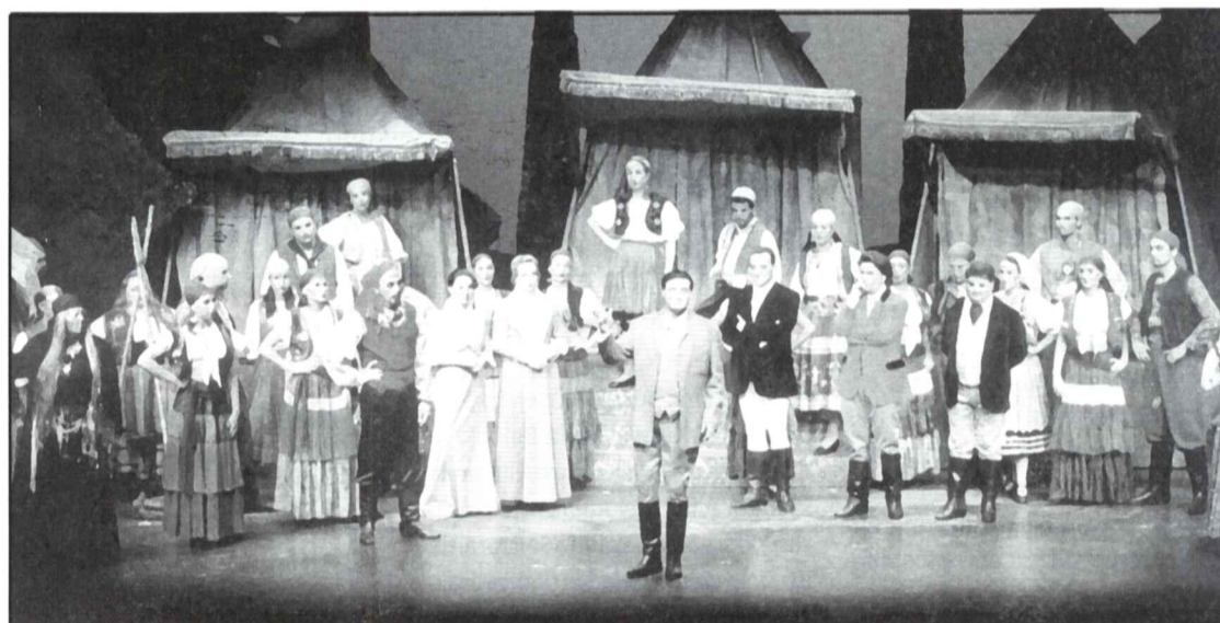
Una escena de la zarzuela "La leyenda del beso".

Magdeburg", una orquesta fundada por la Academia de Música Internacional de Verano de Sehless Hundisburg (Alemania) en 1993 logrando reunir a los jóvenes músicos mas talentosos de dicha academia ofreciéndoles la posibilidad de formar una gran orquesta muy cualificada y tocar por toda Europa. Todos los espectáculos se celebrarán en el Teatro Victoria y darán comienzo a las 10,30 de la noche.