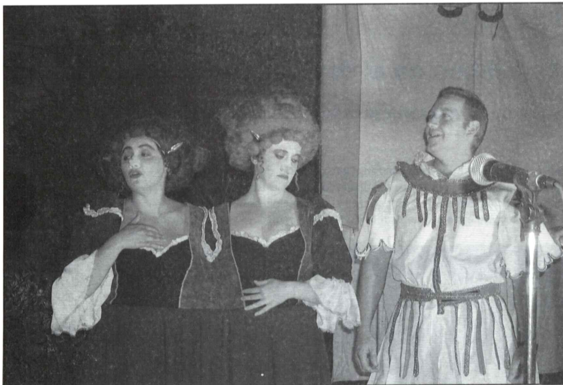
San Jorge y el Dragón.

de recetas de repostería sefardí preparadas para la ocasión por el restaurante El Aljibe.