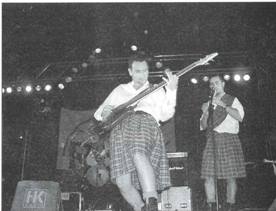
Grupo Saurom Landert.

Los pasados días 21 y 22 de julio se celebró el Festival Asituna-Rock 2000 en el Recinto Ferial de Priego. Los conciertos se desarrollaron con normalidad y aproximadamente a la hora fijada. Contó con la asistencia de unas 8.000 personas entre los dos días. El buen funcionamiento de la carpa dance y las actuaciones musicales de los 15 grupos participantes, disimularon el escaso éxito del mercadillo y el taller de radio.