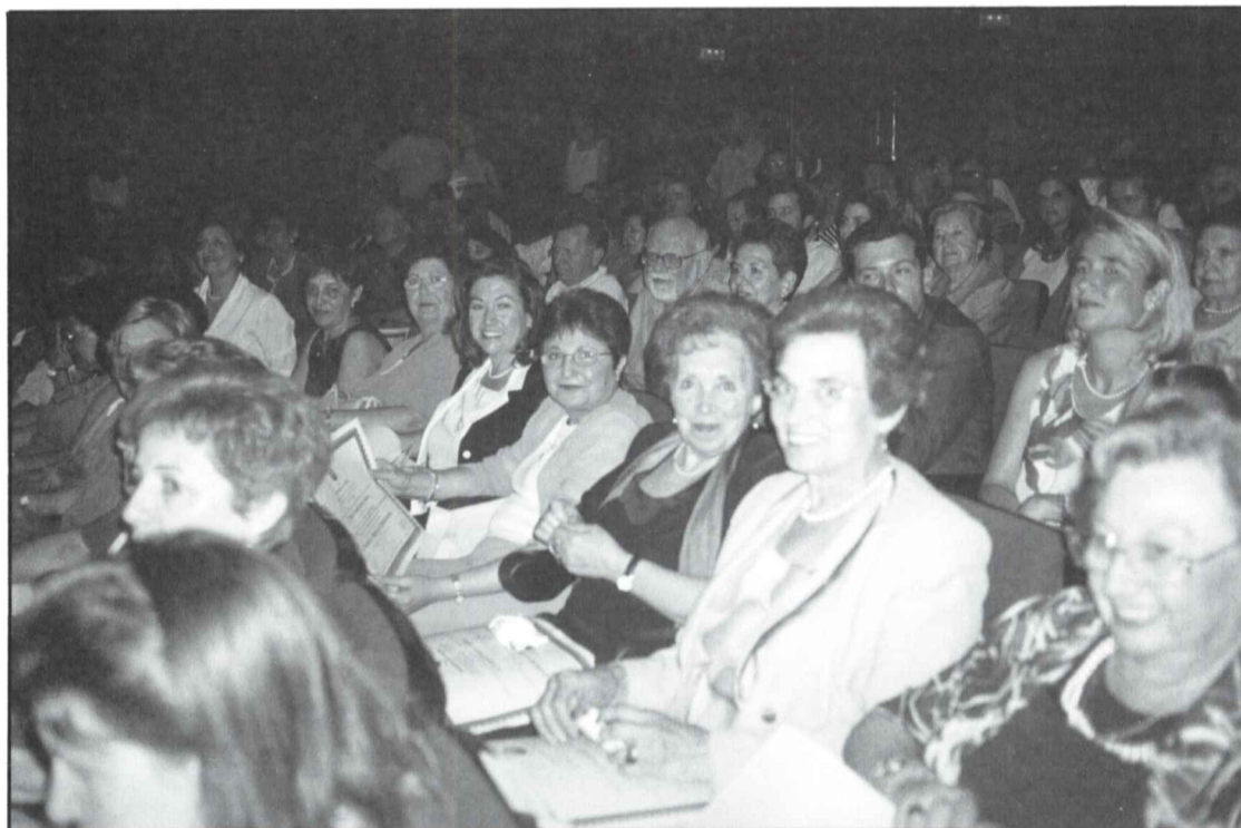
Grupo de tituladas de Priego