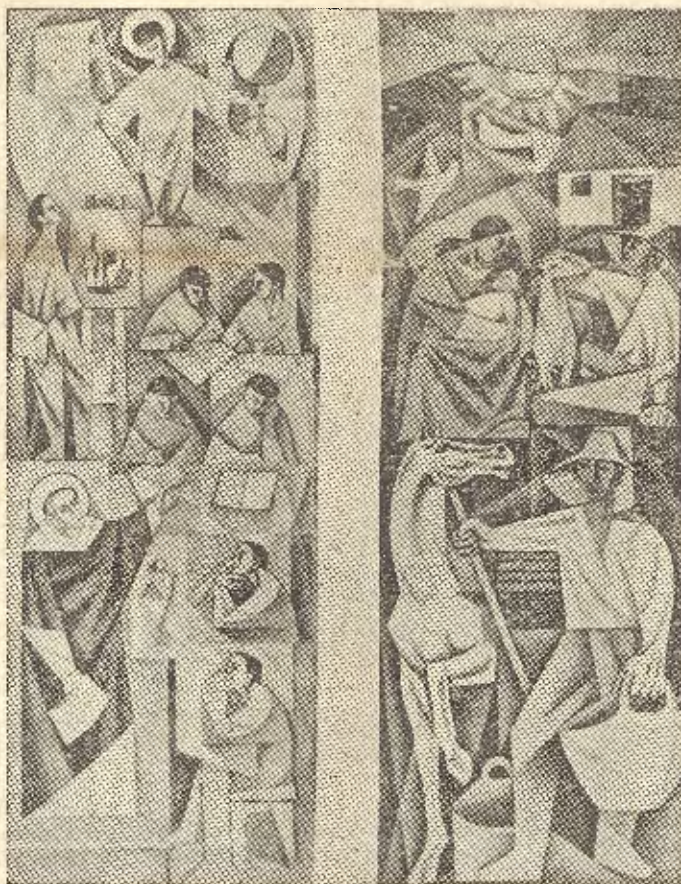
MURALES LATERALES DEL VESTIBULO DEL I. L.

problemas imprevistos durante el trabajo?