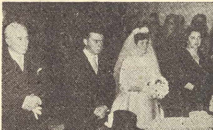
Novios y padrinos en un momento de la ceremonia celebrada el 21 de Diciembre