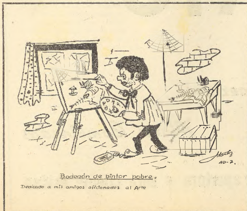
Bodegón de pintor pobre.

Dedicado a mis amigos aficionados al Arte