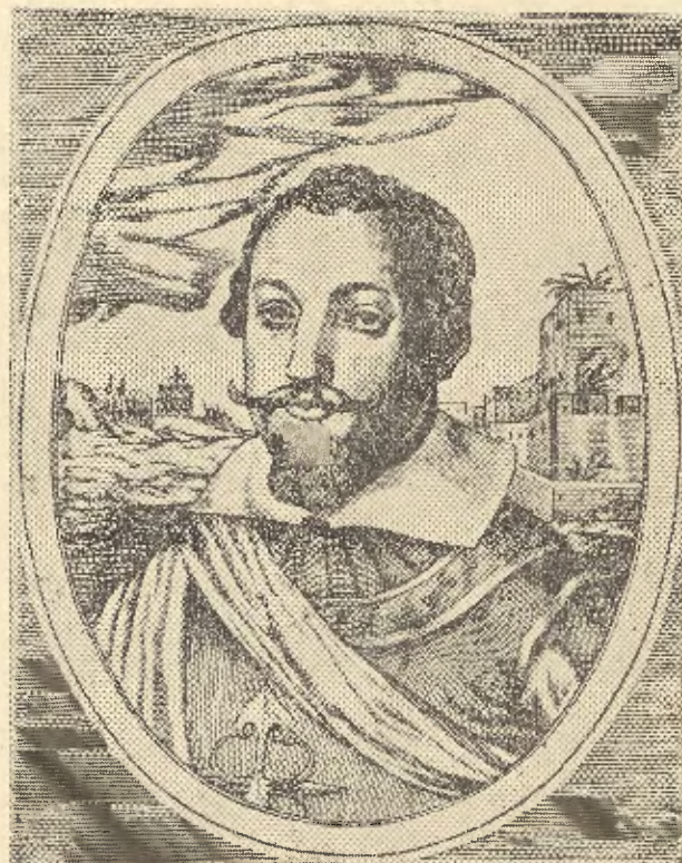
El tercer Conde de Feria

Los pleitos iban desangrando la potente casa de tal manera que, años después del acuerdo con la Iglesia Catedral, tiene el racionero de la misma Don Luis de Góngora, el famoso poeta, que recurrir a la vía judicial—el 6 de Octubre de 1595—, para poder cobrar al marqués los mara-