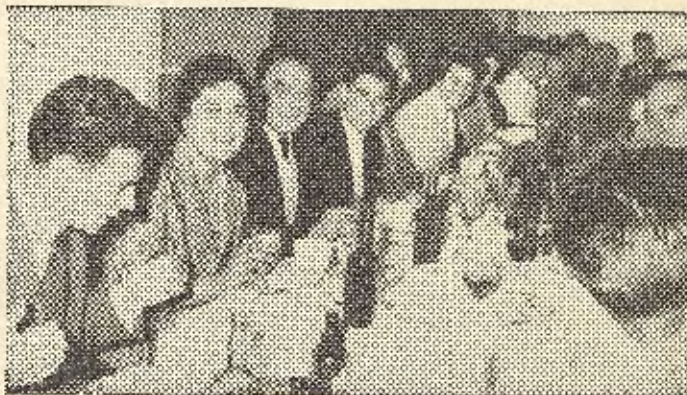
UNA VISTA PARCIAL